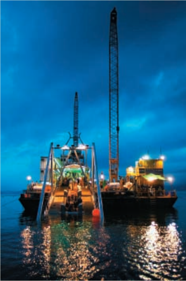
香港中華煤氣鋪設海底管道，由廣東液化天然氣接收站，輸送天然氣到大埔煤氣廠房。

香港中華煤氣以燃氣項目行之有效運作模式作為楷模，繼續拓展內地供水及排水行業，參與此公用事業令該公司在內地之投資領域更為廣闊。