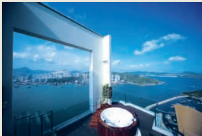
翔龍灣推出預售，其市場反應之熱烈與嘉亨灣如出一轍。

香港中華煤氣過去八年未有增加煤氣基本收費，惟仍一直致力提高營運效益，令業務維持平穩。今年十月公司將正式利用天然氣配合石腦油作為生產煤氣之原料，由於香港中華煤氣早於二零零二年天然氣價格較低時已安排引入天然氣，預期煤氣費將可因而下調，令客戶得益，同時亦增強煤氣在能源市場上之競爭力，有利於香港中華煤氣未來之業務發展。